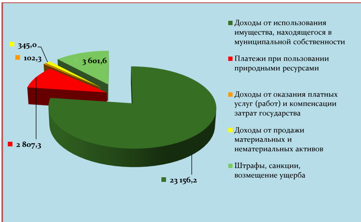
Структура расходов бюджета в 2016 году, (тыс.руб.)